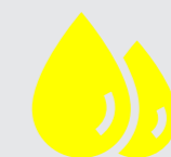
Agua de baja mineralización